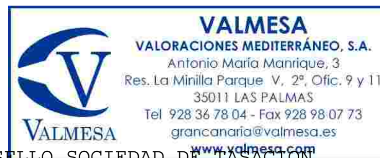
SELLO SOCIEDAD DE TASACION